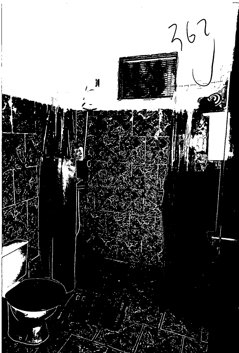
Aspecto do banheiro do imóvel.