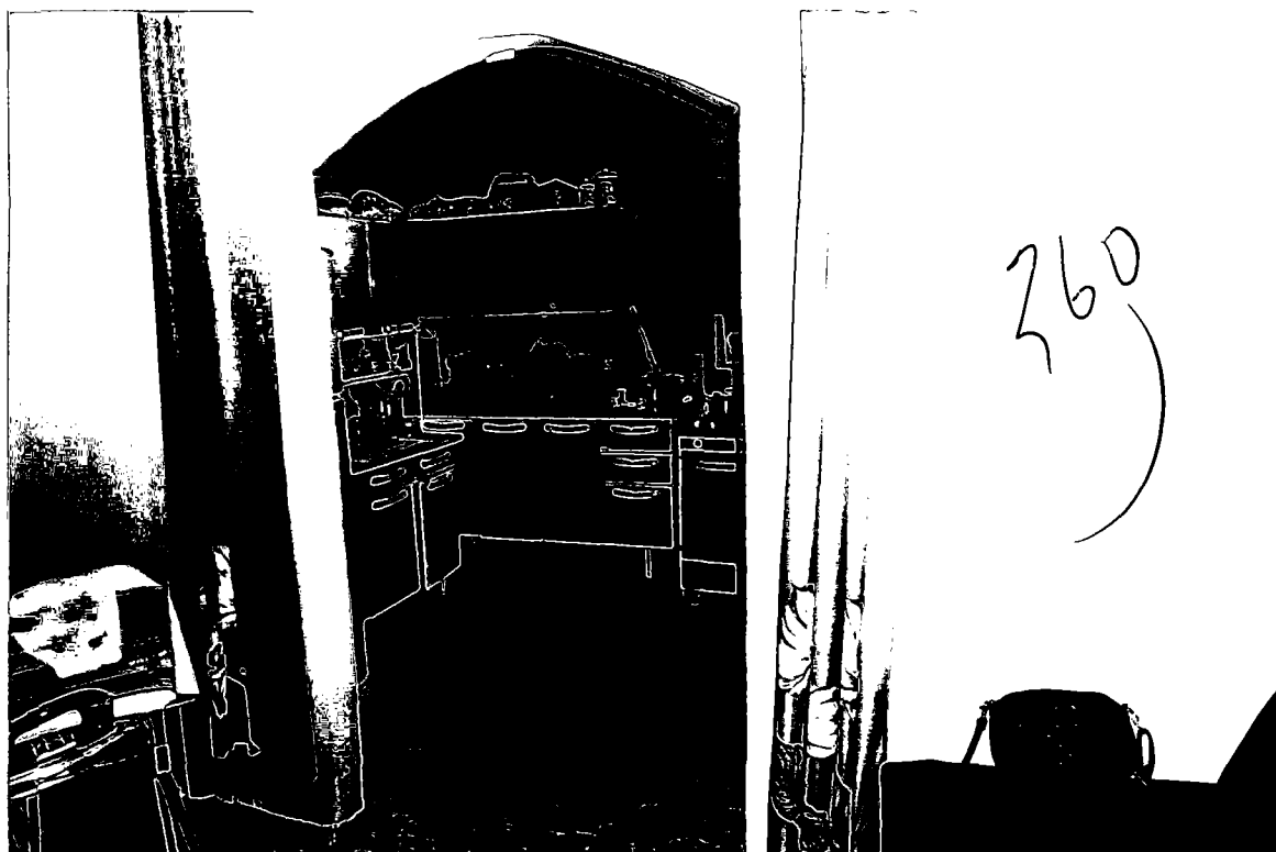
Aspecto da sala e cozinha do imóvel.