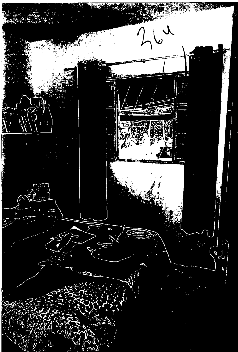
Aspecto do dormitório do imóvel.