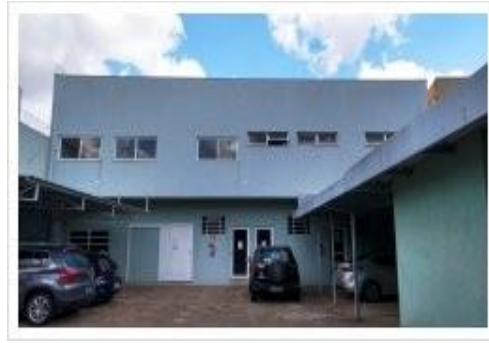
FOTO 2: Edificação nos fundos do imóvel